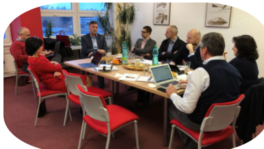
SCHŮZE VÝBORU CAIM leden - prosinec od 16:00 hod.