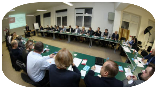
ČLENSKÁ SCHŮZE CAIM 18. ledna 2023 od 16:00 hod.