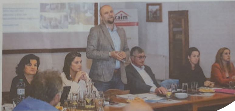
Výroční zasedání České asociace interim managementu