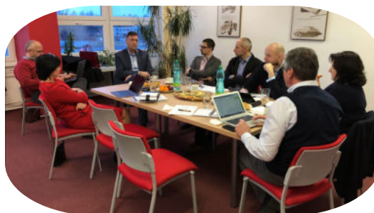
SCHŮZE VÝBORU CAIM leden - prosinec od 16:00 hod.